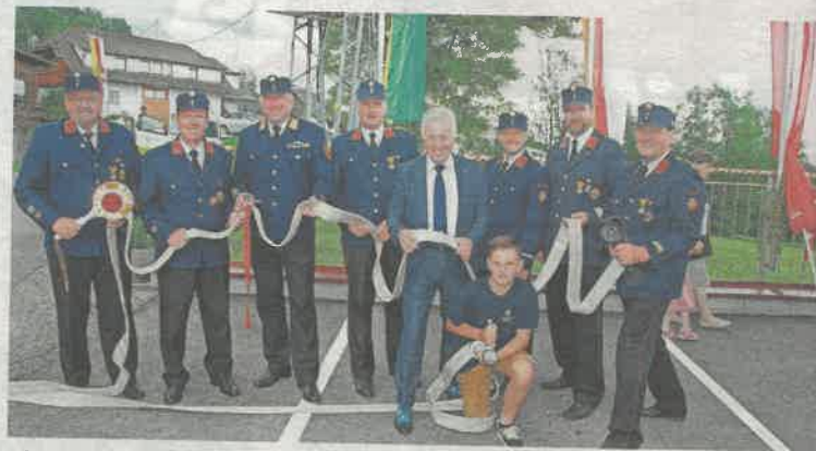
Die Moosburger Feuerwehren und die Gemeinde Moosburg freuen sich auf die Teilnehmer am Leistungswettbewerb.

Gleichzeitig zum Leistungswettbewerb findet auch ein