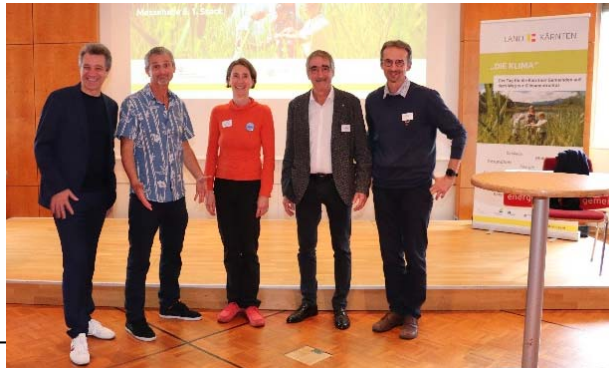
Foto: v.l.n.r.: Lercher (Arztekammer), Hutter (Med-Uni Wien), Stitzel (FH Kärnten), Trampitsch (KABEG LKH Villach), Stefan (ZAMG)

Nachlese zum Tag der Kärntner Gemeinden auf dem Weg zur Klimaneutralität