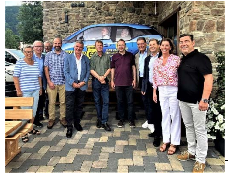
Foto: Infotag Kaprun 28.06.22 Gemeindevertreter aus Maria Saal treffen den Vorstand von MOBIL 60+ Kaprun

Senior:innen fahren für Senior:innen: In der jüngsten e5-Gemeinde Kärntens wird Mobil 60+, das soziale Mobilitätsprojekt der Gemeinde Kaprun, übernommen. Nach Exkursion nach Kaprun und tatkräftiger Unterstützung und bereitwilliger Übermittlung von Wissen, Erfahrung und technischen Grundlagen durch die Erfinder:innen soll dieses Projekt in Maria Saal als LEADER-Kleinprojekt umgesetzt werden. Der Verein befindet sich in Gründung, ein E-Auto und der Grundstock an ehrenamtlichen Fahrer:innen sind bereits organisiert. „Es ging recht einfach“, freut sich die e5-Betreuerin der Gemeinde, „die von den Erfinder:innen zur Verfügung gestellten Infos haben den Prozess sehr erleichtert. Dieses Projekt stellt nicht nur einen gemeindeeigenen Verkehrsservice auf die Beine, es bietet älteren Personen eine tolle Möglichkeit, soziale Kontakte zu pflegen und einen selbstbestimmten Teil ihrer Zeit sinnvoll und anregend zu verbringen.“